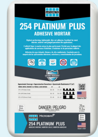
Data Sheet 65329